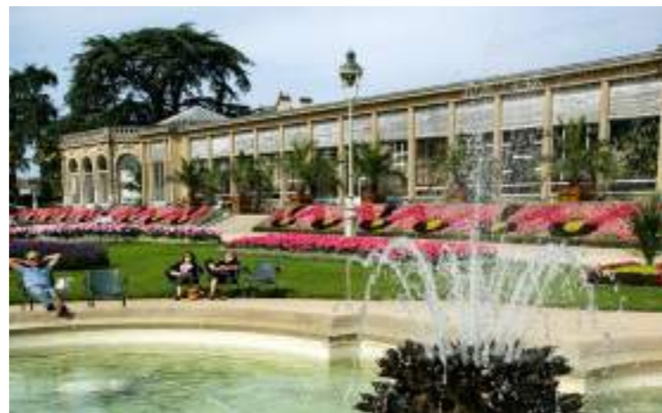
Parc du Thabor