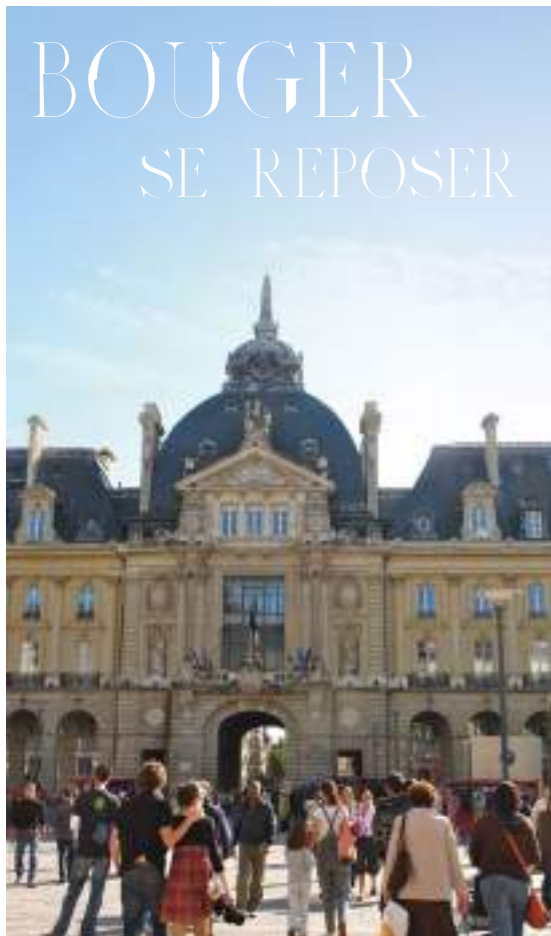
Place de la République

« UN EMPLACEMENT RECHERCHÉ POUR SA PROXIMITÉ DU CŒUR DE VILLE ET DE 2 PARCS D'EXCEPTION »