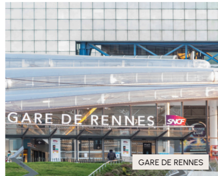
GARE DE RENNES