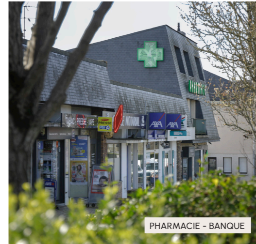
PHARMACIE - BANQUE