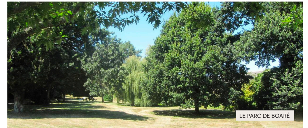
LE PARC DE BOARÉ