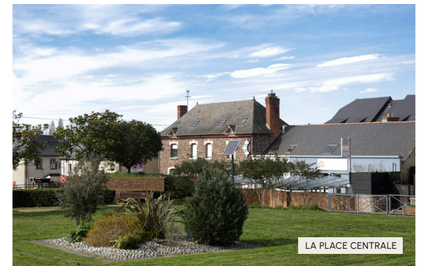
LA PLACE CENTRALE