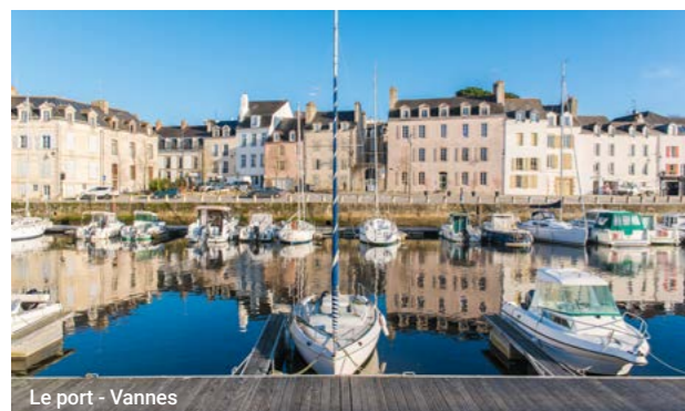
Le port - Vannes

Cap sur une destination bord de mer, en Bretagne sud ! Ici, c'est la douceur de vivre sur les rives du Golfe du Morbihan. Découvrez une ville d'art et d'histoire, animée toute l'année. Son dynamisme économique attire chaque année de nouvelles familles, des étudiants et des entreprises.