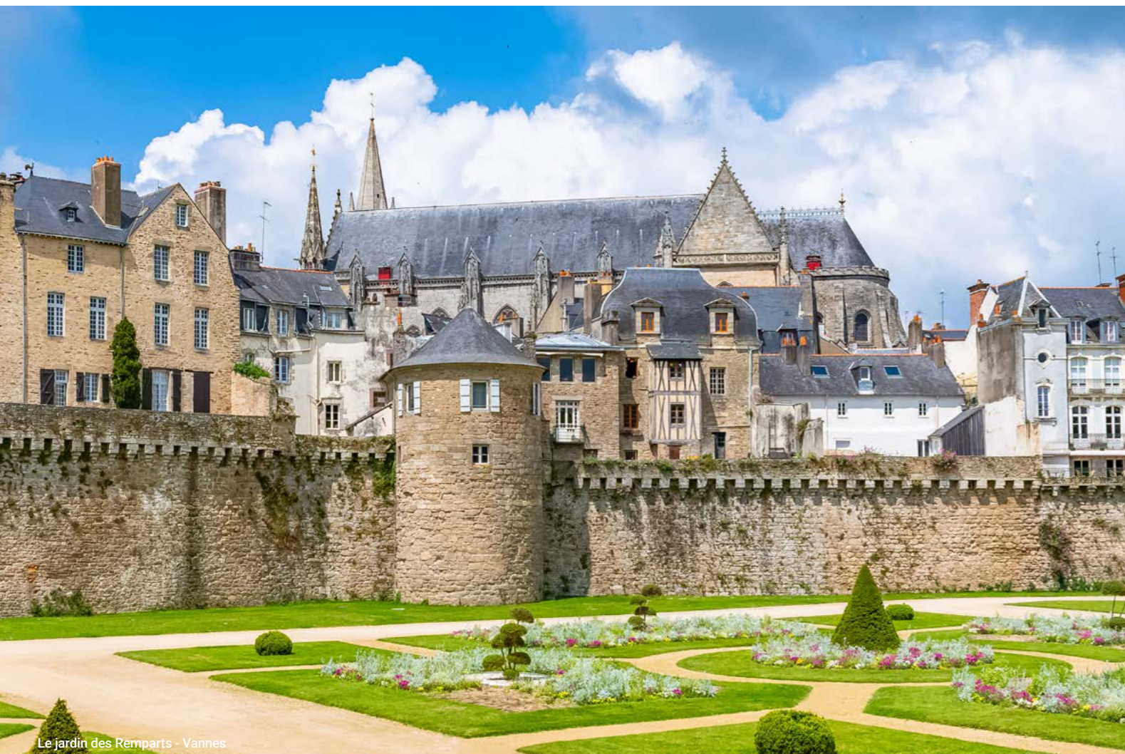
Le jardin des Remparts - Vannes

Cap sur une destination bord de mer, en Bretagne sud ! Ici, c'est la douceur de vivre sur les rives du Golfe du Morbihan. Découvrez une ville d'art et d'histoire, animée toute l'année. Son dynamisme économique attire chaque année de nouvelles familles, des étudiants et des entreprises.