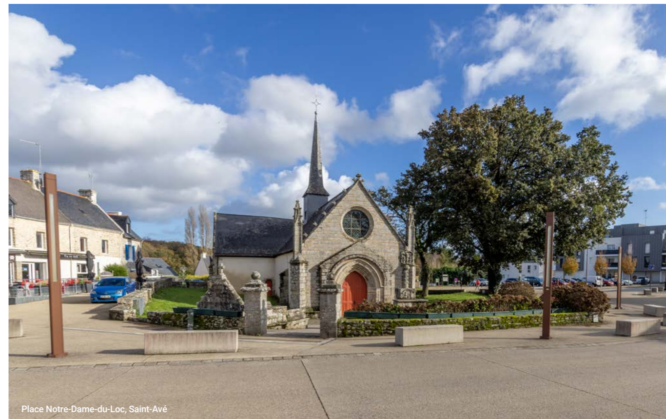
Place Notre-Dame-du-Loc, Saint-Avé