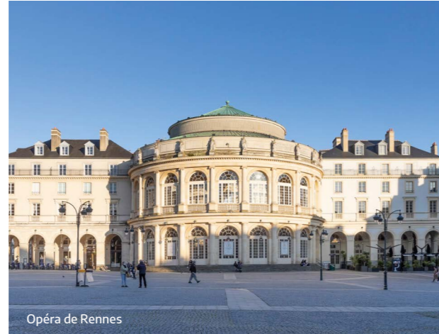
Opéra de Rennes

2 e MÉTROPOLE FRANÇAISE LA PLUS ATTRACTIVE (Hellowork 2022)