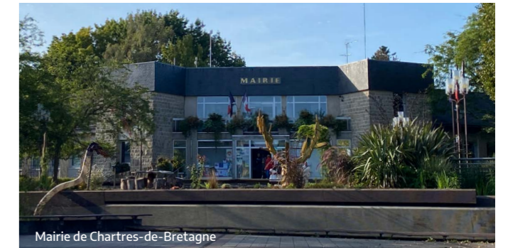
Mairie de Chartres-de-Bretagne