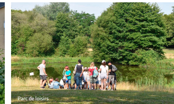
Parc de loisirs