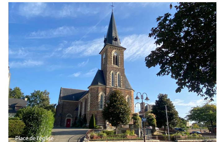
Place de l'église