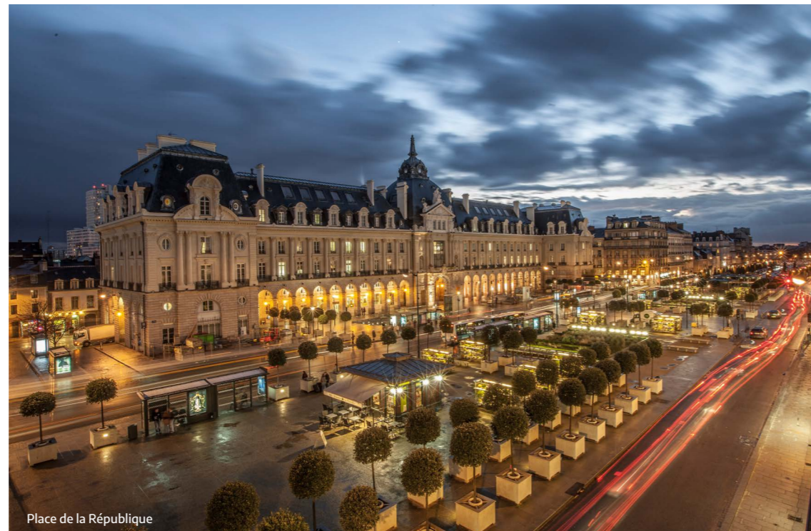
Place de la République