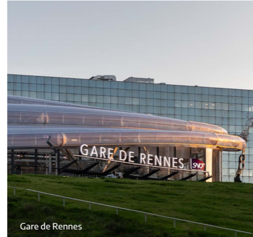
Gare de Rennes