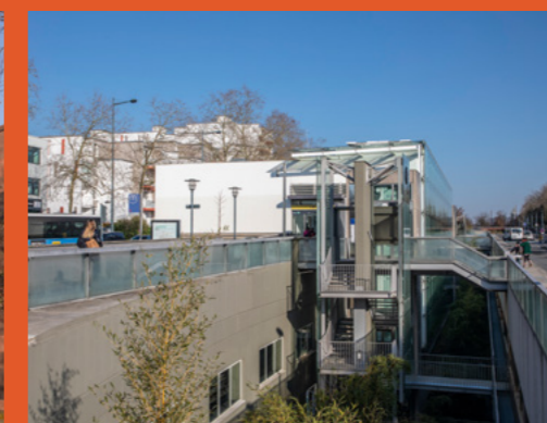
Station de métro Henri Fréville