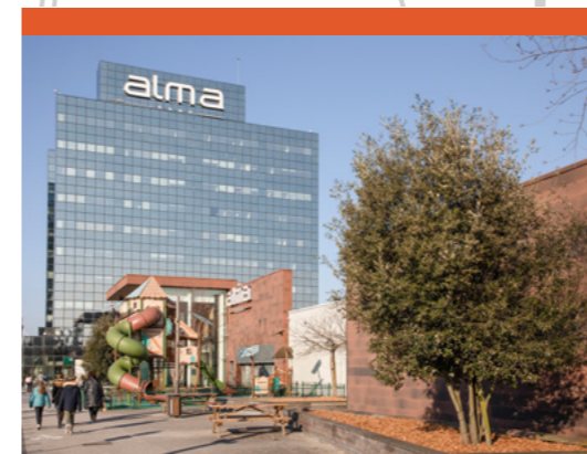
Centre commercial Alma