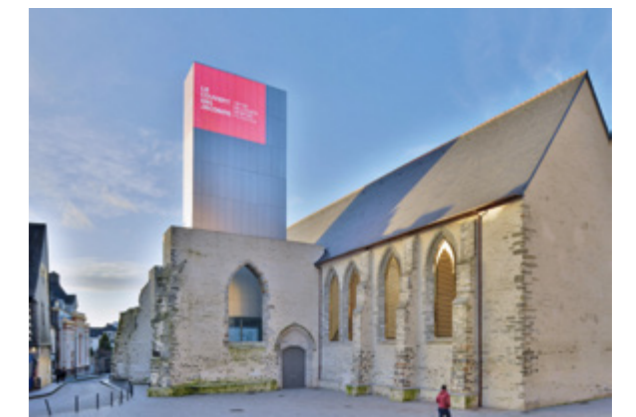
COUVENT DES JACOBINS