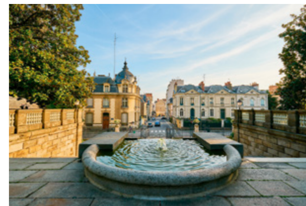
PARC DU THABOR