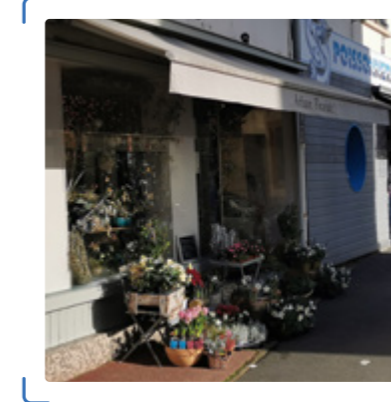
RUE DE PARIS