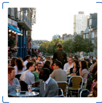
PLACE DES LICES