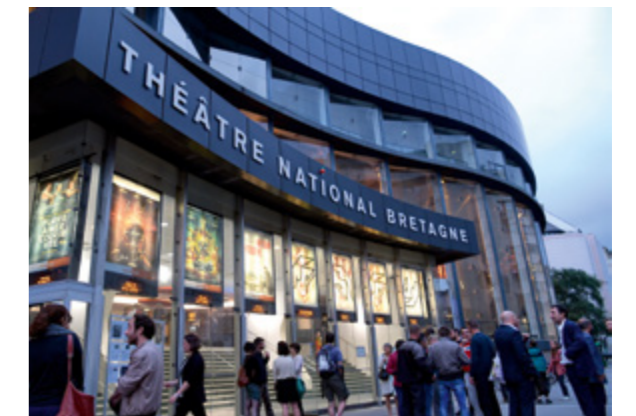
THÉÂTRE NATIONAL DE BRETAGNE

Top palmarès des villes où il fait bon vivre et travailler