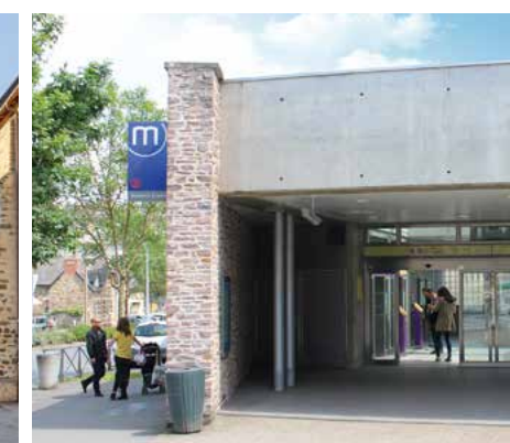
Station Anatole France