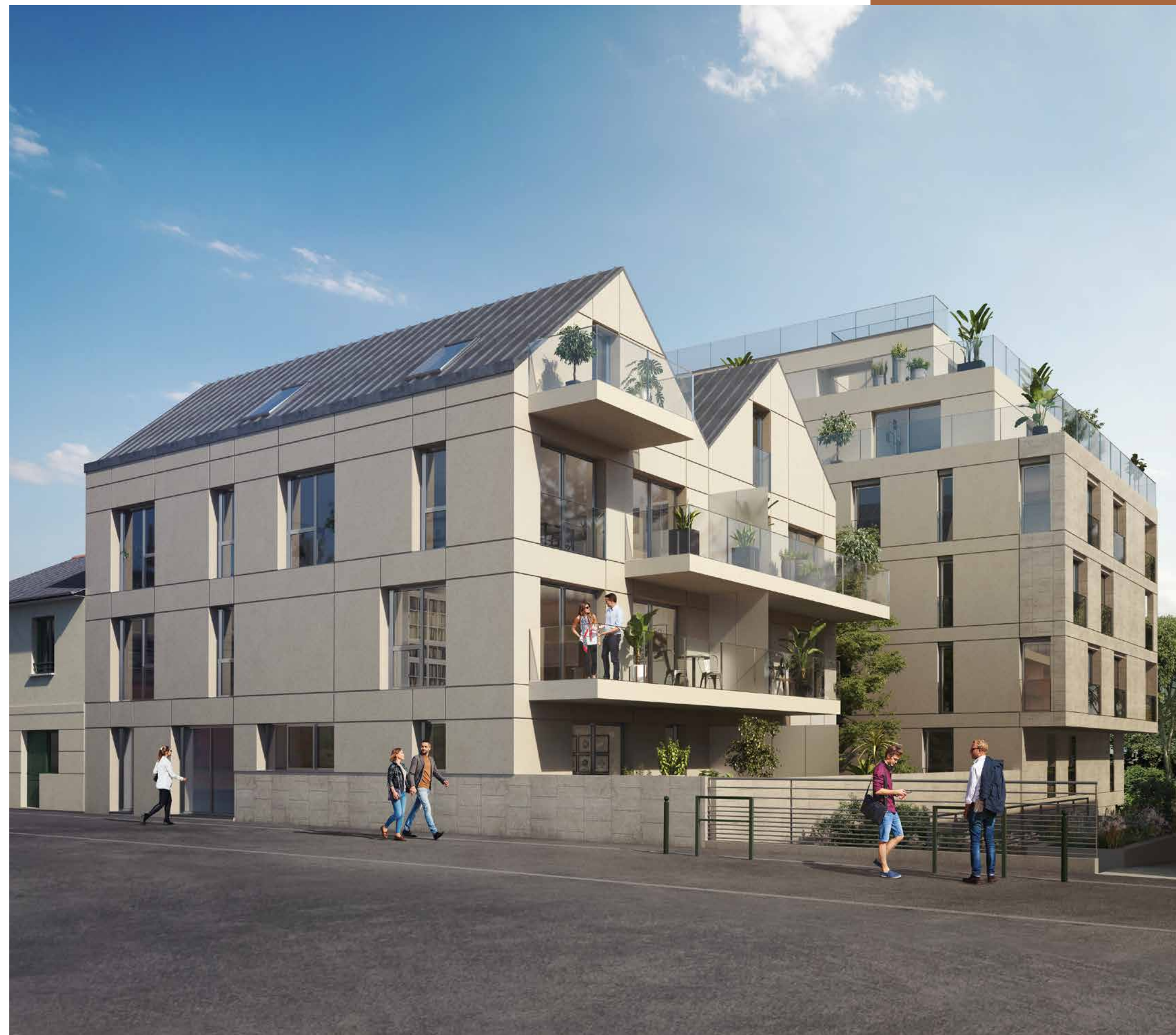
Vue coté : rue Auguste Blanqui

Pour le confort des habitants, la résidence dispose de stationnements en sous-sol et de locaux à vélos.