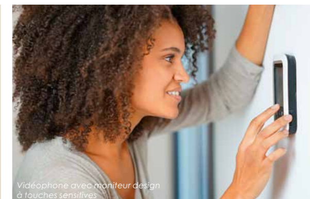
Vidéophone avec moniteur design à touches sensibles